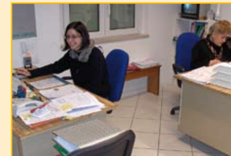
Uffici amministrativi e reparto produzione

Il collegamento più vicino è costituito dalla superstrada (svincolo Val di Chienti) che corre tra Civitanova Marche e Tolentino. L'autostrada Bologna-Taranto (A14) dista una trentina di chilometri.