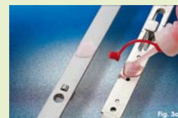
Fig. 3a) La prova viene ripetuta utilizzando un liquido per pulizie con ph 1