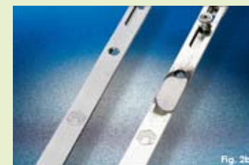
Fig. 2b) Mentre i meccanismi Tricoat si mantengono perfettamente integri, la ferramenta standard presenta segni di corrosione