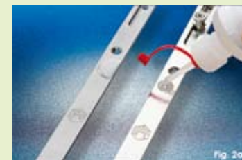
Fig. 2a) Confronto tra ferramenta con trattamento di superficie Tricoat (a sinistra) e standard (a destra). Vengono versate poche gocce di acido cloridrico al 33,3%