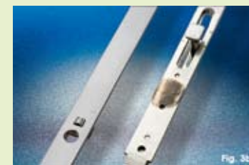
Fig. 3b) Anche in questo caso i componenti Tricoat non vengono intaccati dalla soluzione, che corrode invece la ferramenta standard